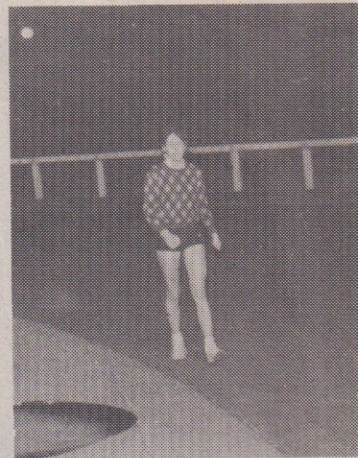
Football, athlétisme ou footing, c